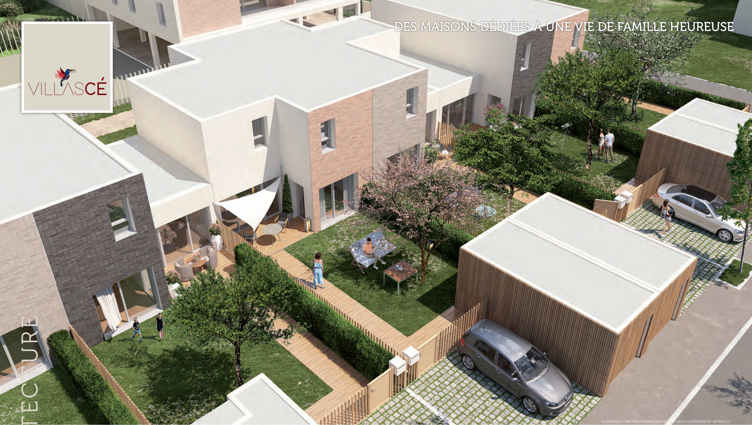
ILLUSTRATION À CARACTÈRE D'AMBIANCE NON CONTRACTUELLES. ILLUSTRATIONS 3D : BÂTIMAGE 2.0

VillasCé compte 7 maisons de ville de 4 à 6 pièces. Depuis la rue Toussaint Louverture, chaque maison dispose d'un garage et d'un portillon donnant sur le jardin privatif et sa terrasse. Une petite allée mène à l'entrée de la maison qui s'ouvre sur un vaste séjour-cuisine. Cette pièce principale est complétée par une chambre et une salle d'eau. Les chambres supplémentaires prennent place à l'étage, offrant calme et intimité à chaque membre de la famille. À la belle saison, parents, enfants et amis se retrouvent au jardin, à l'ombre de son arbre ou autour d'une table pour partager de bons moments, en toute intimité.