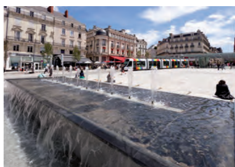
Place du Ralliement à Angers

Aux portes d'Angers et du vignoble de l'Anjou, la ville des Ponts-de-Cé est traversée par la Loire et jalonnée de nombreux ponts, lui ayant valu son nom. Au cœur du "Val de Loire" classé au Patrimoine mondial de l'UNESCO, cette charmante commune vous réserve un cadre de vie unique.