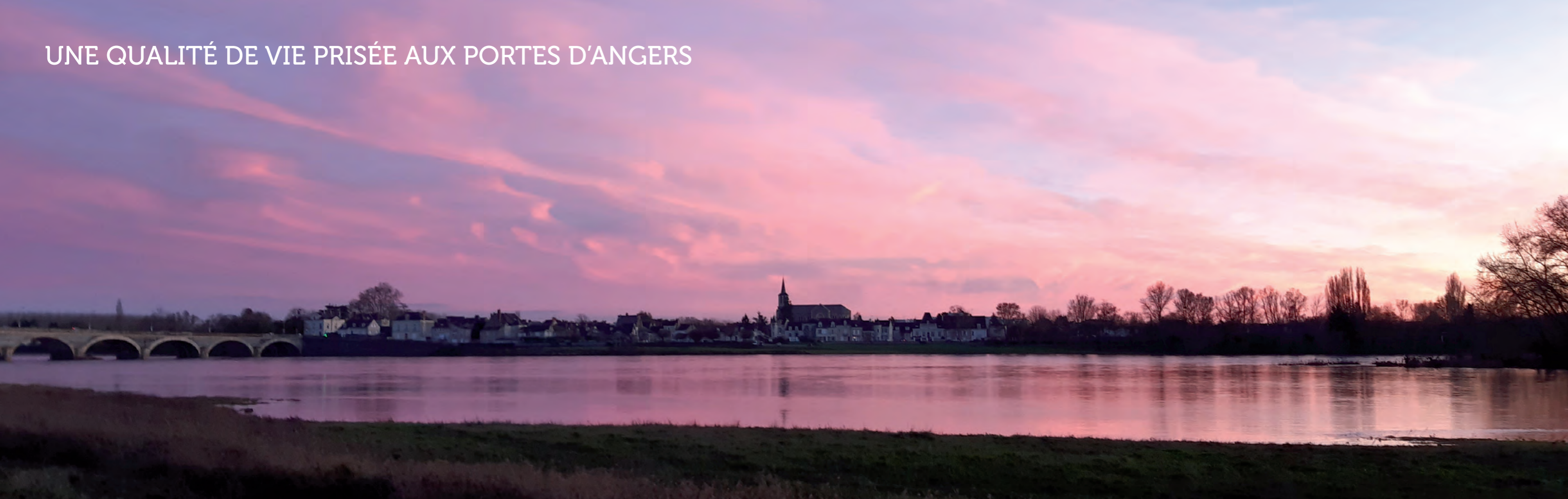
La Loire, le pont Dumnacus