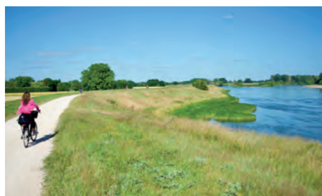
Bords de la Loire