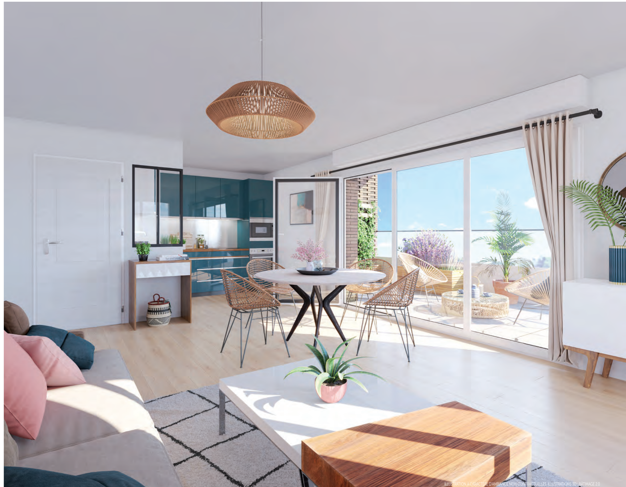
ILLUSTRATION À CARACTÈRE D'AMBIANCE NON CONTRACTUELLES ILLUSTRATIONS 3D - BÂTIMAGE 2.0

Les appartements sont déclinés du 2 au 4 pièces et disposent tous d'une loggia ou d'une terrasse pour apprécier pleinement les jours ensoleillés.