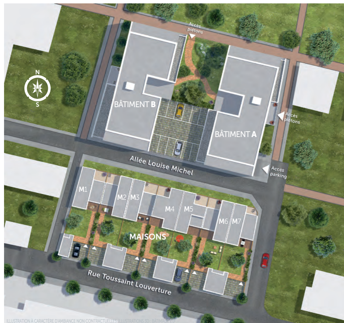
ILLUSTRATION À CARACTÈRE D'AMBIANCE NON CONTRACTUELLES - ILLUSTRATIONS 3D - BÂTIMA 2020