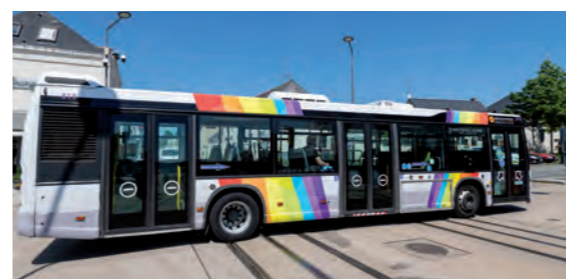
Centre d'Angers en moins de 15 minutes