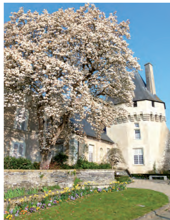
Château des Ponts-de-Cé

Tout en profitant du rayonnement et de la dynamique angevine, la ville des Ponts-de-Cé s'est développée en préservant son patrimoine historique et naturel. Elle est aujourd'hui le compromis idéal entre animation et douceur de vivre.